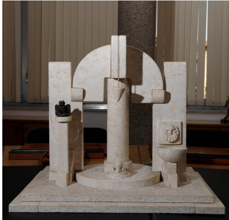
bozzetto per la porta della sapienza